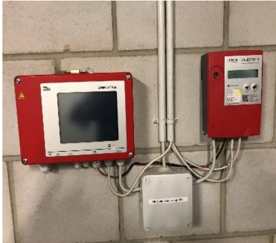
A04 - Individuelle Heizkostenzählung mit präziser Verbrauchs-Abrechnung