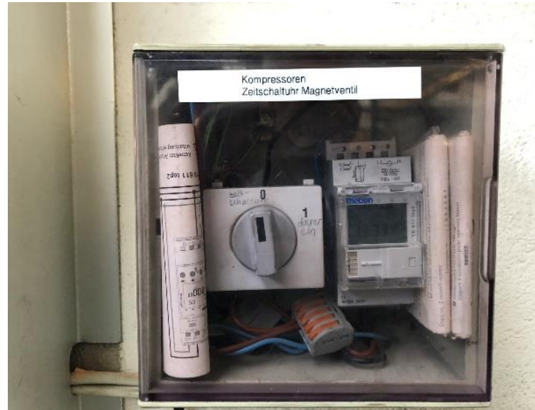
A07 - Kompressoranlagen gesteuert über Zeitschaltuhr mit Magnetventil