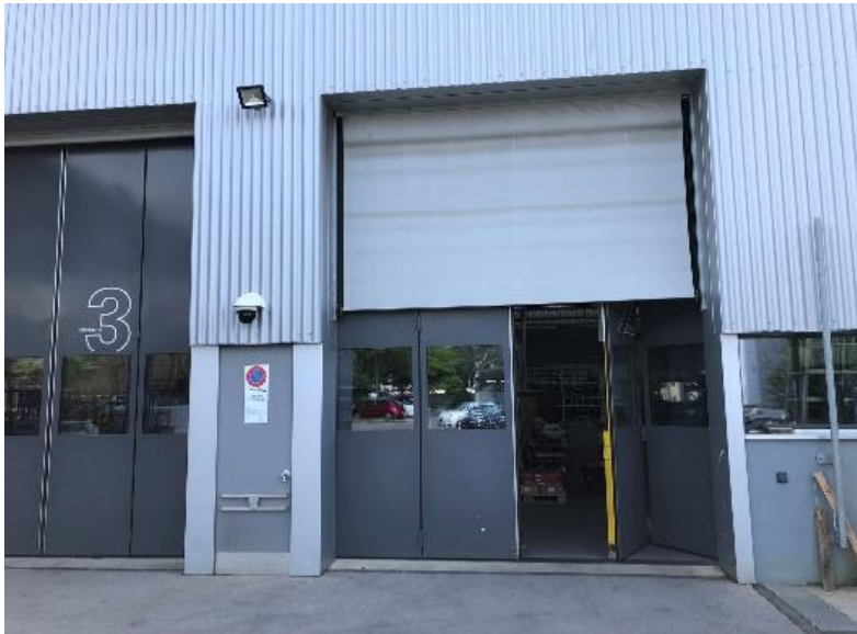
A06 - Alle 4 Falttore ausgerüstet mit Schürzen (damit im Winter beim Öffnen weniger Wärme abfließt)