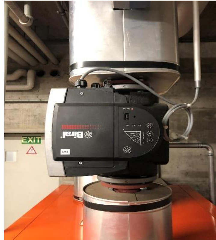
A05 - Modernste elektronisch Drehzahlgesteuerte Heizungspumpen